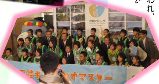
【最後はみんなで記念撮影！】