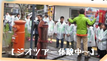
【ジオツアー体験中～】