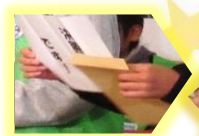
【その手には 決勝の二文字！】