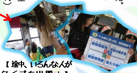
【途中、いろんなクイズを出題！】